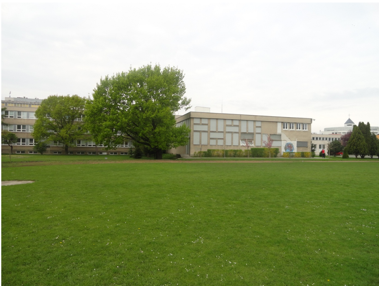
Zrekoštruované ihrisko, parc.č. 1036/2